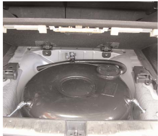
Passt satt: 60 Liter Volumen für 48 Liter Flüssiggas verdrängen Bordwerkzeug und Reserverad – braucht eh kein Mensch