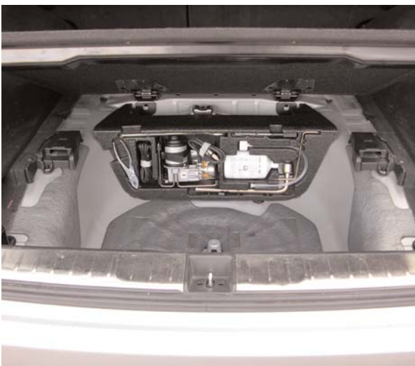
Die nackte Wanne ohne Einsatz: „Gummi- milch“, Kompressor und Wagenheber müssen dem 60-Liter-Gastank weichen