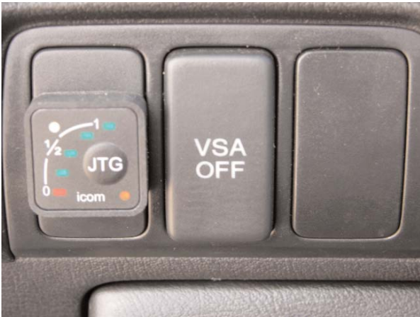
Einzigster Umbau-Zeuge im Innenraum: Ummschalter LPG/Benzin mit Betriebs- und Füllanzeige (links)