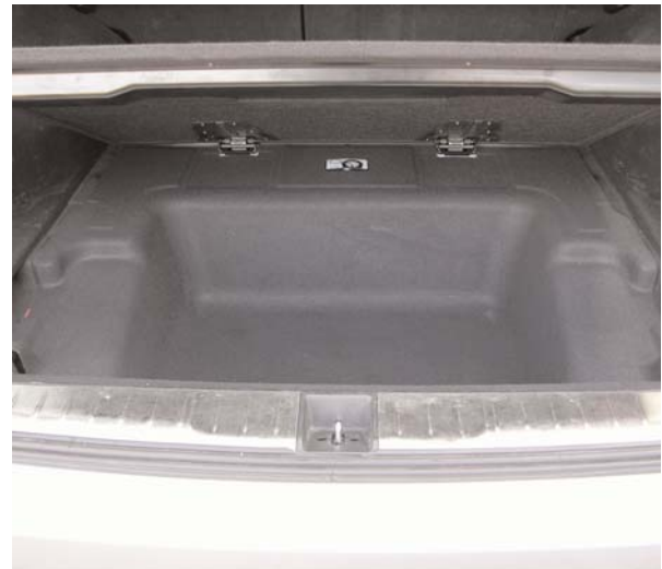
Platz ohne Ende: Unter dem Ladeboden des Honda Accord verbirgt sich die Reserverad- und Werkzeugmulde